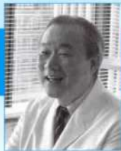
医学博士・産婦人科医

かにいるときの記憶(胎内記憶)を持っています。私の取材した子ども達の声の中に、「お母さんのお腹の中が臭くて早く出てきたよ」と言っている子どもがいました。子供的人格形成は受精した瞬間から胎内環境に支配されています。胎児は、お母さんの食べ物や感情、そして化学物質の影響を受けて成長します。これから親になる方、特に女性にはこれらの事実を知っていただき、近い将来親になることを前提に思春期から生活環境を整えていくことが重要です。